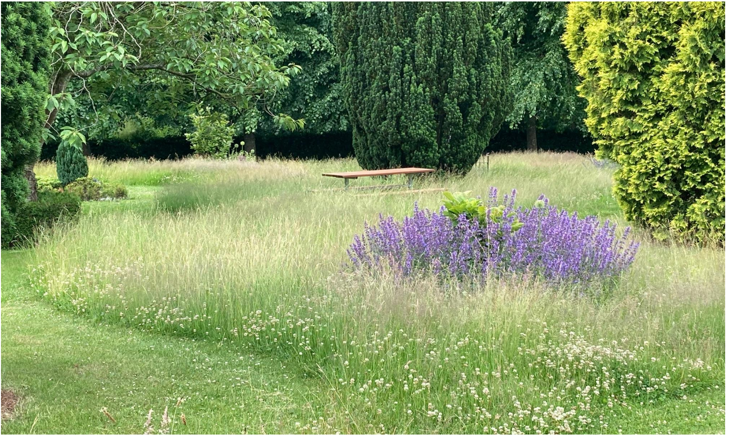
Parti fra Ribe Gamle Kirkegård